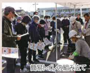
簡易トイレの組み立て