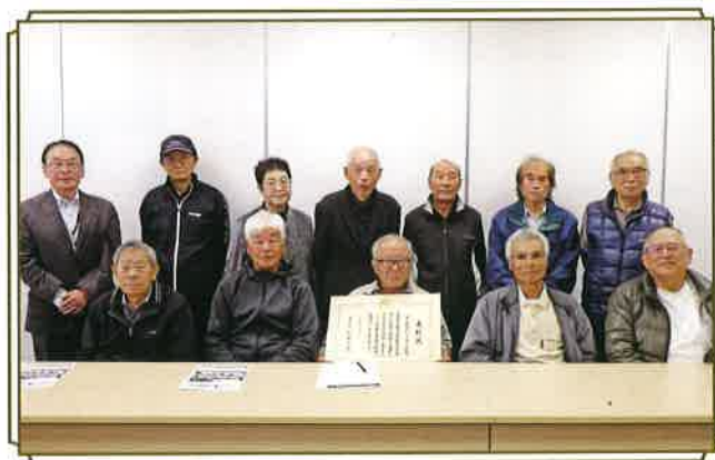
防犯パトロール隊役員のみなさん