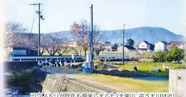
ヨウソトリが昨年も飛来しました（大東川・逆さま川付近）

最後になりましたが、地域の皆さまのご健康とご多幸をお祈り申し上げるとともに、丸亀市ならびに法の郷地域社会の一層の発展を念じまして、新年のご挨拶といたします。