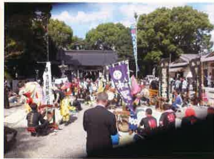
《秋季例大祭》奉納七組獅子舞