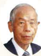
飯山南コミュニティ協議会