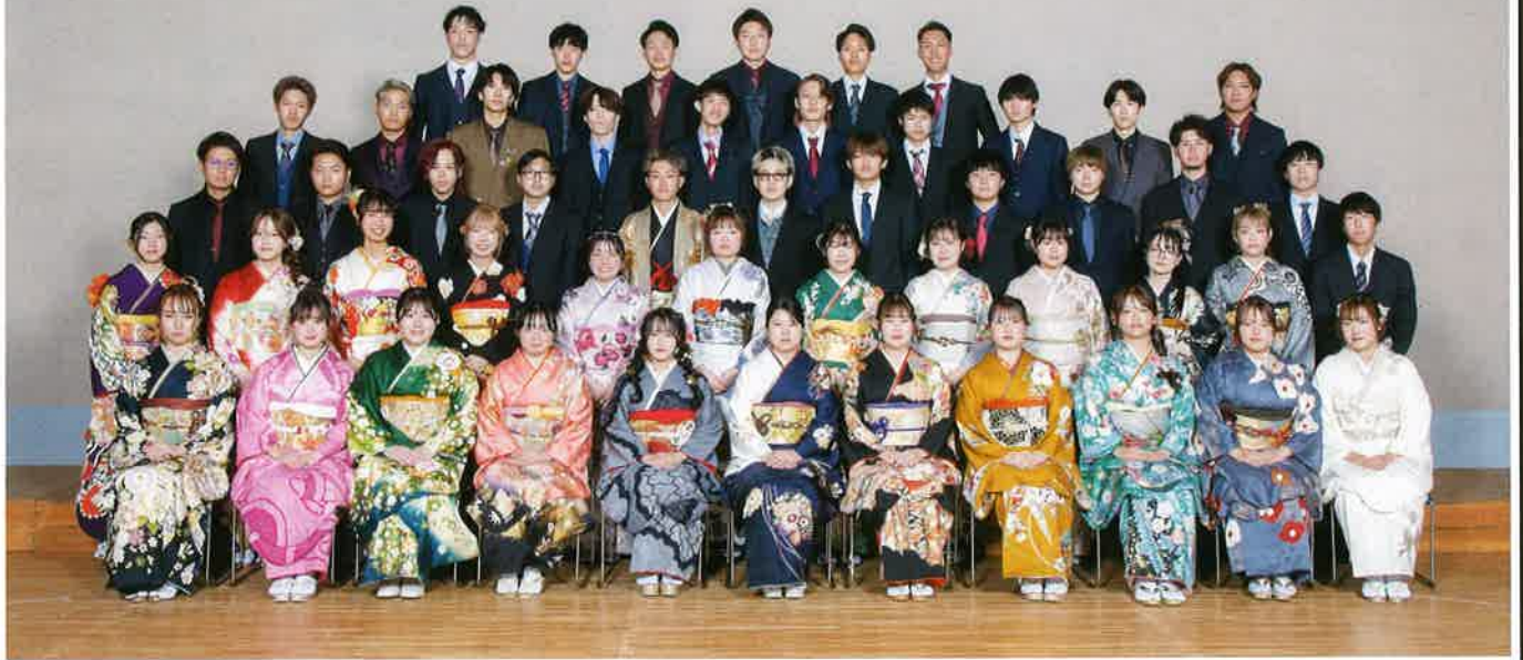
令和7年 丸亀市二十歳の成人式 飯山南校区 令和7年1月12日