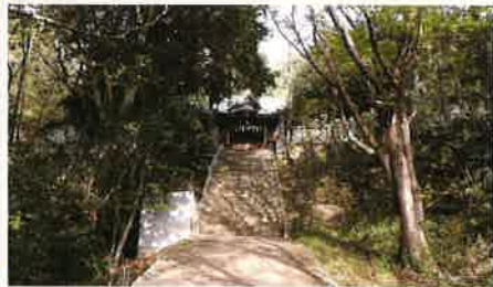
参社殿西向き・正面参道

●香川県内鎮座十五神社 ●横潮神社(シリーズNO.24 十五) ⑥ 鎮座地 坂出市福江2677番地 《横潮神社(よこしおじんじや)》 祭 神 天照大御神(横潮大明神) 神社由緒 【讃留霊記(さるれいき)】によれば、景行天皇の時代(西暦71~130年頃)、坂出沖に往来の船ごと飲み人間までも飲み込む大きな悪魚が現れて人々を悩ませていました。