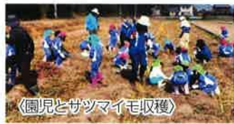
〈園児とサツマイモ収穫〉

ばならず、創業当初は苦勞しました。2010年には有機JAS認証を取得し、2.7ha(東京ドームの約半分)の畑で年間およそ80種類の野菜を栽培しています。