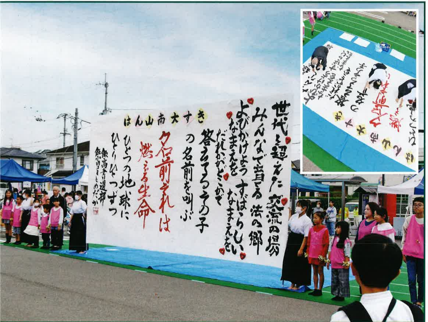
11/17 いきいきまつり(飯山高校書道部・書道教室めだか・法の郷書道教室)