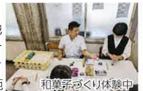
和菓子づくり体験中

6日非公開日に、高校生が地元で行われている仕事を知り、その魅力を再発見する取組「アオ活」を地元企業5社を招いて実施しました。多くの生徒が各社のブースを訪れ、好奇心や興味をもって働くことの意義を再認識していました。