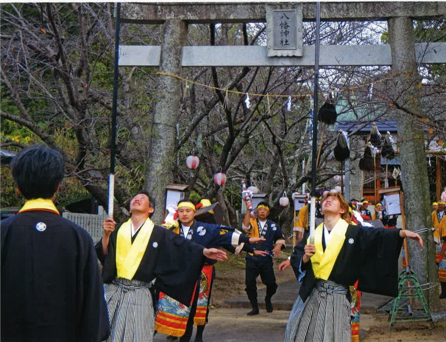
八幡神社秋祭り(東小川奴連)