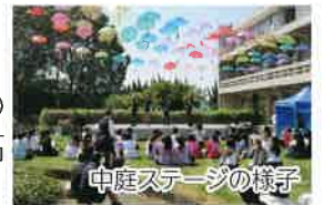
中庭ステージの様子