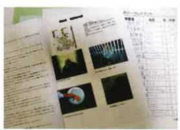
【探検しての気づきが克明に表現された表現物】

例えば、訪問した動物園の名称や特徴とそこに飼育されているゴリラの名前や年齢、性別や特徴、一日の食事内容、飼育委員さんに質問した内容「ゴリラが喜ぶとき・怒るとき、お気に入りの場所・飼育していて今まで大変だったこと等」を写真も入れて分かり