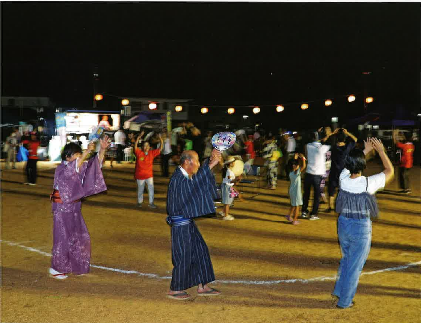
8/24 法ノリ サマーフェスティバル「総踊り」